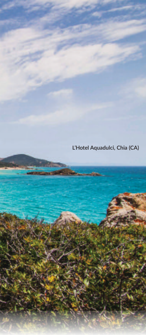
L'Hotel Aquadulci, Chia (CA)

di Su Giudeu a Chia (CA), riconosciuta dalla Guida Blu di Legambiente la più bella d'Italia. È raggiungibile a piedi o tramite una passerella per passeggiate con pause per bagni rigeneranti o per osservare le specie di uccelli rari come i fenicotteri rosa. Si possono organizzare escursioni a cavallo per ammirare le diverse bellezze naturali di Chia e spingersi fino al porticciolo di Teulada. Per rilassarsi si può optare anche per una gita in barca a vela e per chi ama il movimento, non mancano percorsi in mountain bike, moto, biciclette, corsi di kitesurf e windsurf, tennis e golf. I profumi della macchia mediterranea inebriano anche il giardino dell'hotel, dove troneggia una piscina con idromassaggio e dove le piante officinali della Sardegna creano l'atmosfera di una piccola oasi dedicata al benessere. Da provare i trattamenti e massaggi. Per alcune tipologie di camere è incluso il servizio spiaggia nella meravigliosa Su Giudeu. ( www.aquadulci.com )