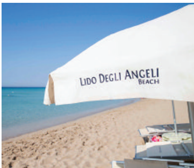
Lido degli Angeli Beach a Punta Prosciutto (LE)